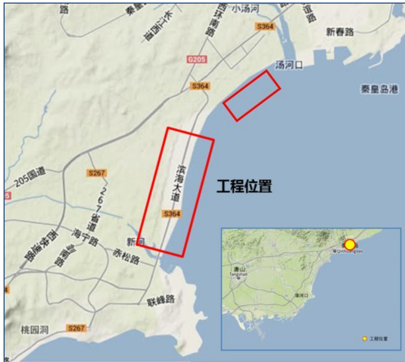
图1 项目地理位置图

本项目位于秦皇岛市北戴河区东北侧沿海地区，金屋至浅水湾浴场岸线，整治区域坐标约北纬39°51'00"~39°53'06"，东经119°31'12"~119°31'51"之间处。本项目地理位置见图1。